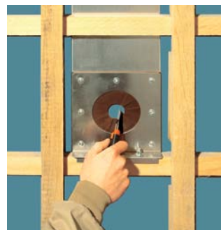
Herstellen der Einblasöffnung