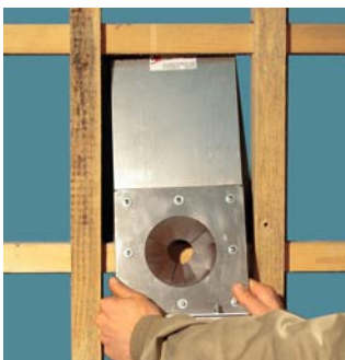
Einhängen in die Lattung

Standortwechsel leicht gemacht: der Einblasfachmann kann die X-Floc Einblasblende schnell von Einblasstelle zu Einblasstelle mitnehmen. So lässt sich viel Zeit sparen.