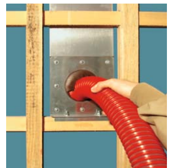
Einführen des Einblaschlauchs

Einblasblende , Aluminiumblende mit Gummi-Rosette zum staubdichten Einführen des Einblaschlauches NW 50 bis 75 (Art.-Nr. 2911)