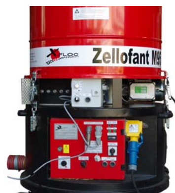
Zellofant mit Häckselwerk